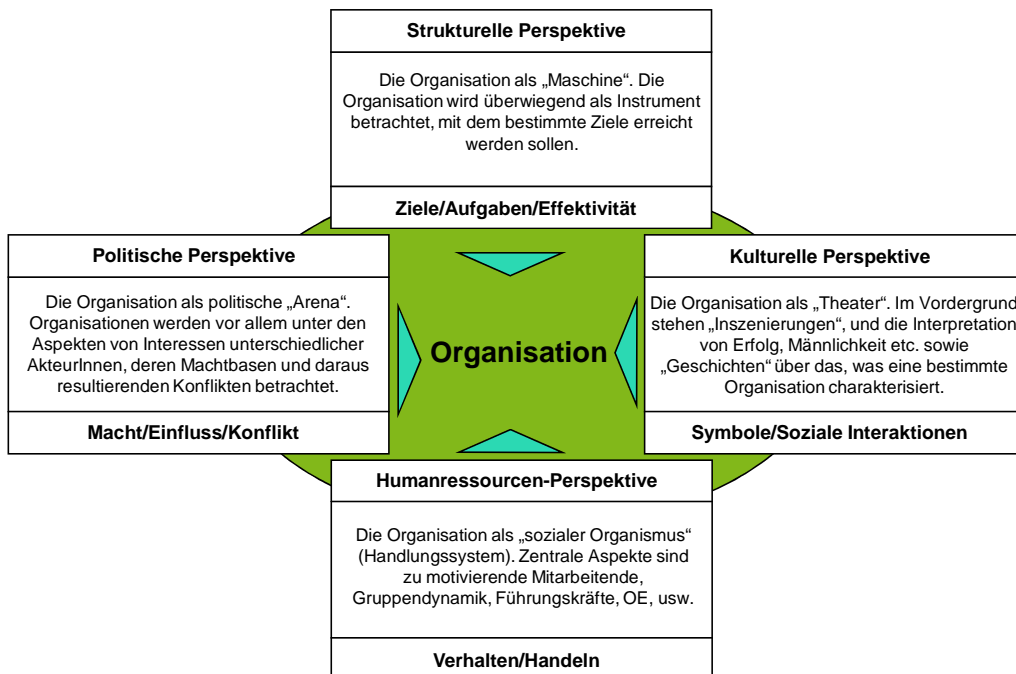
Abb.3: Vier Perspektiven in Veränderungsprozessen (in Anlehnung an Bolman & Deal, 2003)

Die nachfolgende Abbildung zeigt die vier Perspektiven mit den zentralen Metaphern und der jeweiligen Aufmerksamkeitssteuerung im Überblick: