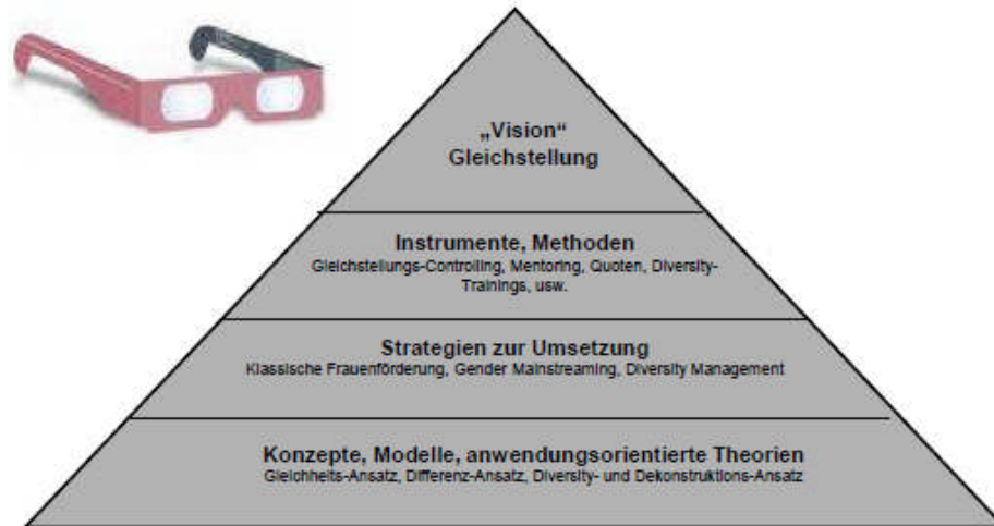
Abb.1: Übersicht über Modellansätze, Strategien und Instrumente zur „Vision“ Gleichstellung (Müller / Sander, 2009)

Bei allen Debatten um treffende Konzepte, geeignete Ansätze, Strategien und Massnahmen gilt es, das oberste Ziel, oder besser die Vision, nicht aus den Augen zu verlieren. Wir verstehen Gleichstellung als eine übergeordnete Vision. Die Zielsituation „Gleichstellung“ beschreibt eine Gesellschaft oder auch eine Organisation, in welcher alle Mitglieder ihre persönlichen Fähigkeiten und Potenziale frei entwickeln und entfalten können, ohne durch geschlechterdifferenzierende und andere Rollenerwartungen oder sonstige Zuschreibungen eingeschränkt zu werden. Eine gesellschaftliche Situation, in der die unterschiedlichen Verhaltensweisen, die unterschiedlichen Ziele und Bedürfnisse von Menschen respektiert, anerkannt und gefördert werden und alle Menschen die gleichen Chancen im Zugang zu Ressourcen, Beteiligung und Entscheidungsmacht haben.